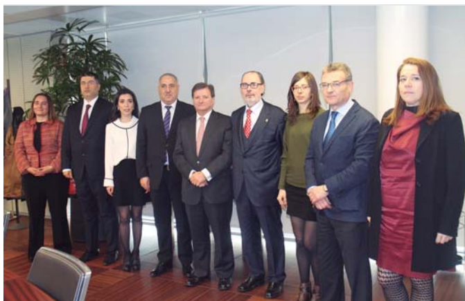
Representantes de la Aduana de Azerbaiyán, de DHL, de la Asociación Internacional de OEAS y del Puerto de Barcelona, tras la reunión mantenida en la sede de la autoridad portuaria catalana.