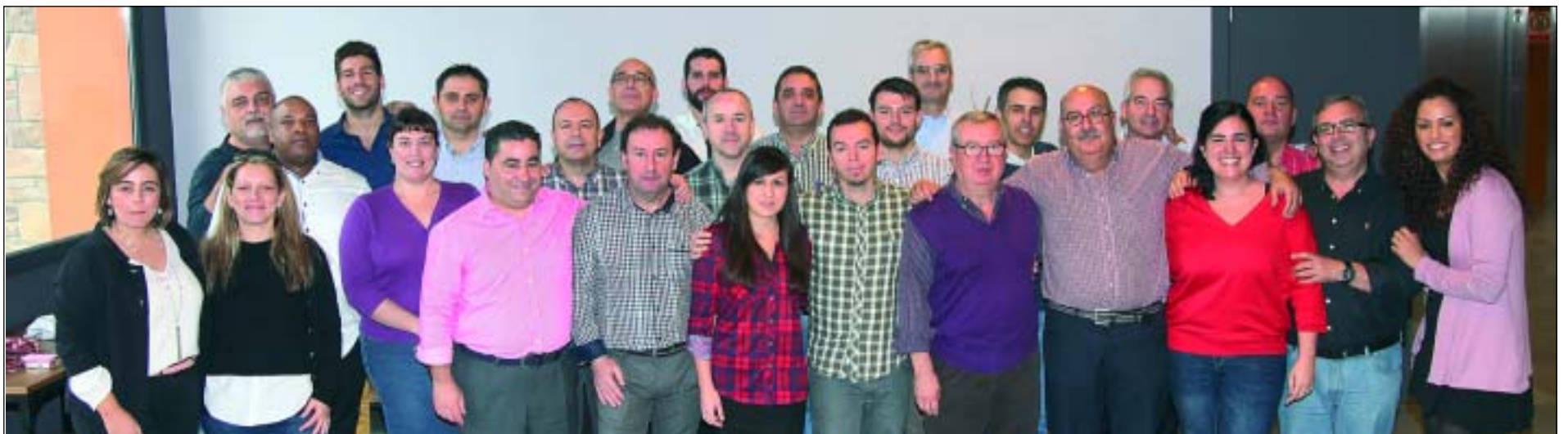
Equipo de colaboradores de Tracosa Aduanas

valorar y revisar el actual plan estratégico así como para perfeccionar un nuevo y ambicioso proyecto para los siguientes tres ejercicios, en donde se podría incluir la internacionalización con alguna apertura en el exterior.