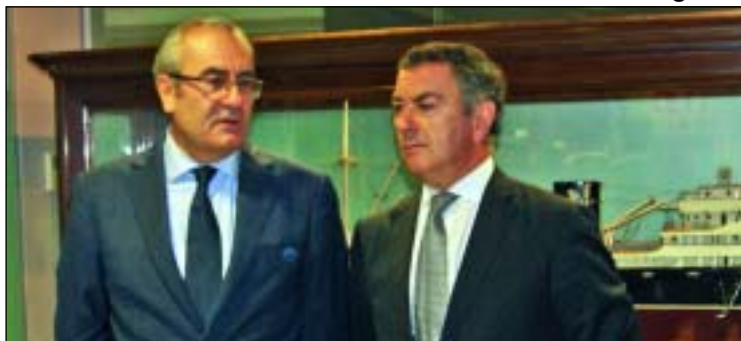
José Llorca, presidente de Puertos del Estado, y José Ángel Corres, presidente de la Cámara de Bilbao